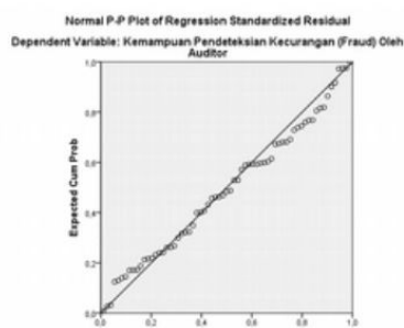
Grafik Normal P-Plot

Dari hasil output SPSS Normal P-Plot pada gambar diatas dapat diketahui bahwa titik-titik menyebar disekitar garis diagonal dan mengikuti garis diagonal dan penyebaran titik-titik data searah dengan garis diagonal, maka nilai residual tersebut telah normal dan ini membuktikan bahwa model regresi dalam penelitian ini telah memenuhi uji normalitas. Hasil uji normalitas juga dapat dilihat dengan melakukan uji normalitas dengan kolmogorov smirnov.